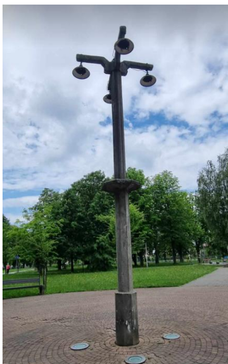
Fotografia 6. Widok na latarnie na terenie podobożu Jawischowitz.