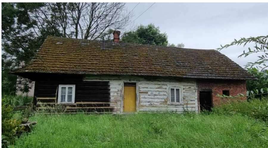
Fotografia 12. Przykład budownictwa drewnianego w miejscowości Zasole.

dwuspadowym, z szalowanymi szczytami. W starszej redakcji występuje bielienie lub oblepianie gliną msze między bekami zrębu. Nowsza redakcja, występująca najliczniej, to niewielki dom o zwartej bryle i dwuizbowym układzie wewnątrz. Część budynków posiada nadal oryginalną stolarkę okienną i drzwiową, a niekiedy także oryginalne belki z inskrypcjami i datami.