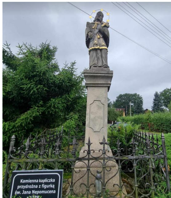
Fotografia 4. Widok na figurę z posągiem św. Jana Nepomucena w Skidzinie.