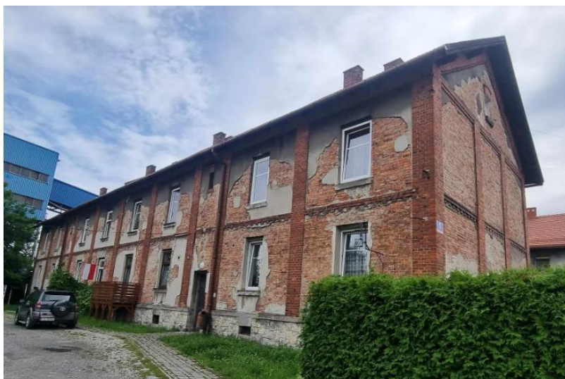
Fotografia 8. Przykład budynku mieszkalnego na terenie osiedla robotniczego Starej Kolonii.

Stan zachowania większości obiektów dostateczny. Wymagają podjęcia działań konserwacyjnych.