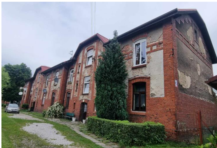
Fotografia 9. Przykład budynku mieszkalnego na terenie osiedla robotniczego Nowej Kolonii.

Stan zachowania większości obiektów dostateczny. Wymagają podjęcia działań konserwacyjnych.