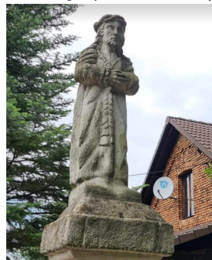
Fotografia 3. Widok na kapliczkę z Chrystusa.

Figura wyrzeźbionego w kamieniu Jezusa w cierniowej koronie jest najprawdopodobniej najstarszym świątkiem na terenie Gminy. Z przekazu ustnego wiadomo, że kapliczka została postawiona pod koniec XVIII lub w pierwszych latach XIX wieku. Przez całe lata była punktem, przy którym brzeszczanie odchodzący w ślad za chlebem czy nauką żegnali rodzinną wioskę, powierzając w modlitwie do Chrystusa swoje dalsze losy. Pod kapliczką