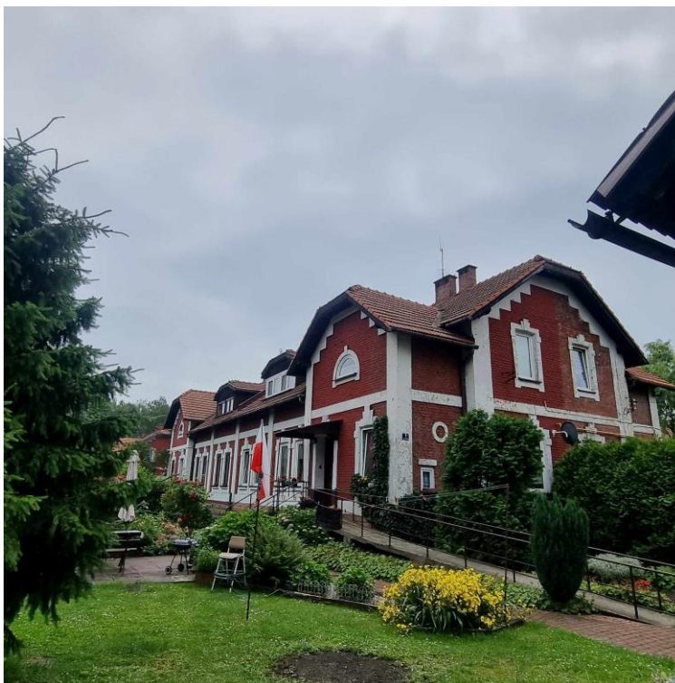
Fotografia 10. Przykład budynku mieszkalnego na terenie osiedla robotniczego Kolonii Urzędniczej.

Kolonia Urzędnicza zlokalizowana jest w niedalekiej odległości od kopalni. To zespół parterowych domów wzniesionych dla dyrekcji, inżynierów i sztygarów. Stan zachowania obiektów dobry.