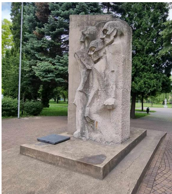
Fotografia 7. Widok na pomnik ku czci ofiar podbozu Jawischowitz.