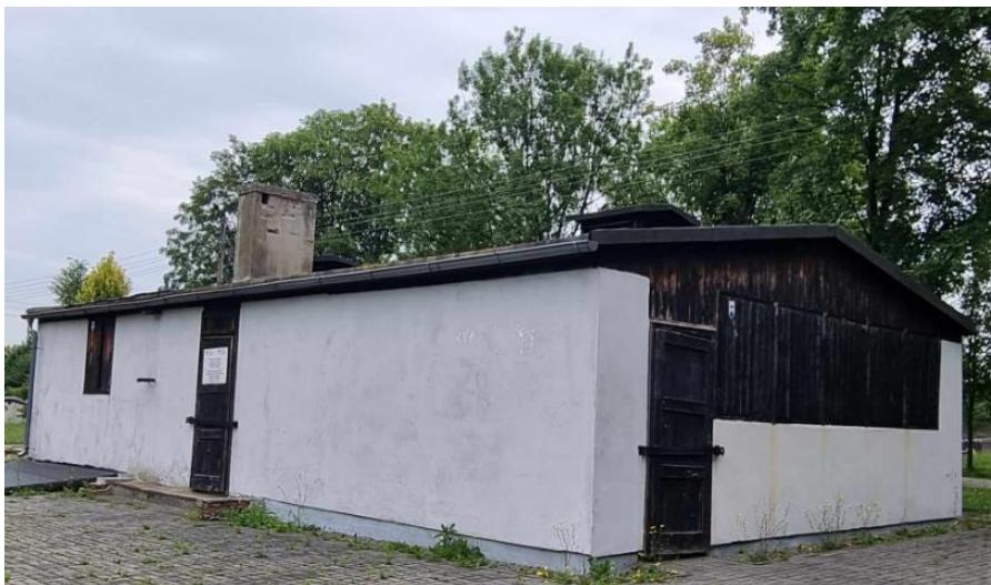
Fotografia 5. Widok na łaźnie podobożu Jawischowitz.