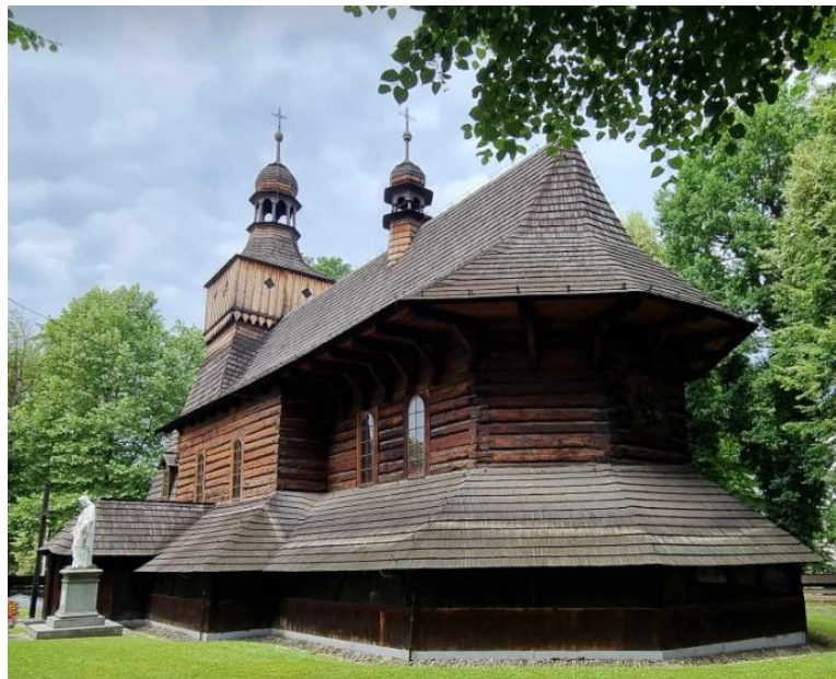
Fotografia 1. Widok na Kościół parafialny p.w. św. Marcina z Tours w Jawiszowicach.

izolowane balustradą o pełnym deskowaniu oraz – powyżej – płytami z pleksi i drobną siatką zabezpieczającą, co tworzy zamkniętą przestrzeń o starannie wykonanej posadzce z płyt kamiennych, w której przygotowywana jest właśnie ekspozycja różnego typu zabytkowych sprzętów kościelnych. W nawie, na osi kruchty południowej, sfazowany, prostokątny portal zamknięty łukiem odcinkowym. Stan zachowania dobry.