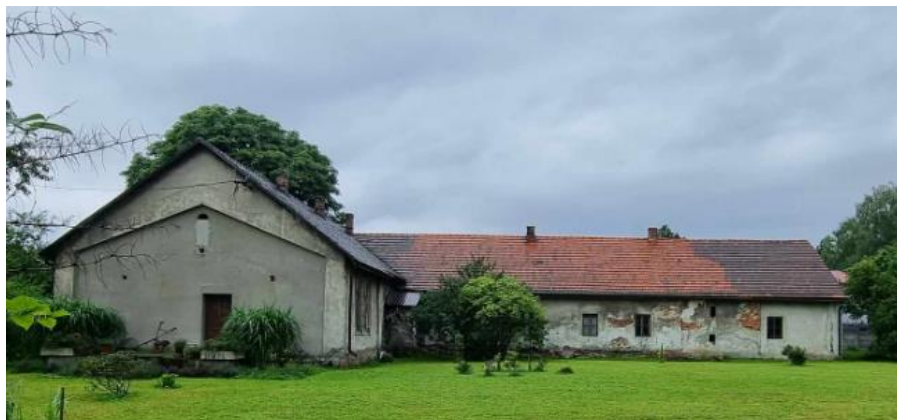
Fotografia 11. Dwór w miejscowości Skidziń.