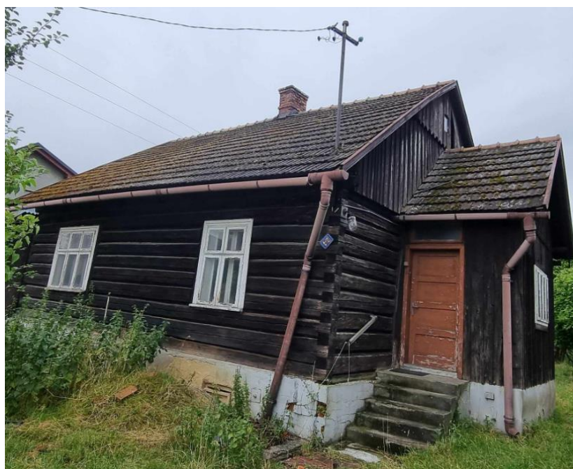
Fotografia 13. Przykład budownictwa drewnianego w miejscowości Przecieszyn.